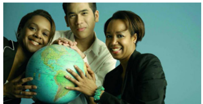
Bilderbogen der Ausstellung 60 Jahre Festival junger Künstler