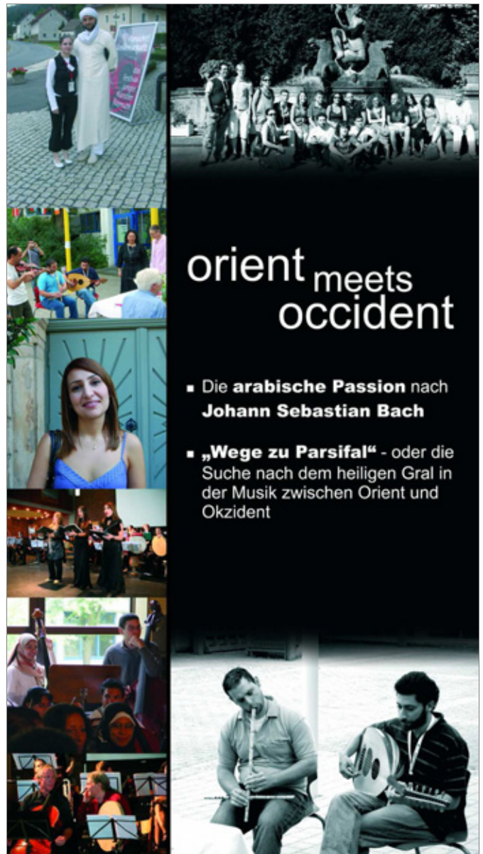
Bilderbogen der Ausstellung 60 Jahre Festival junger Künstler